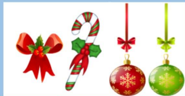
اللون الأحمر والأخضر