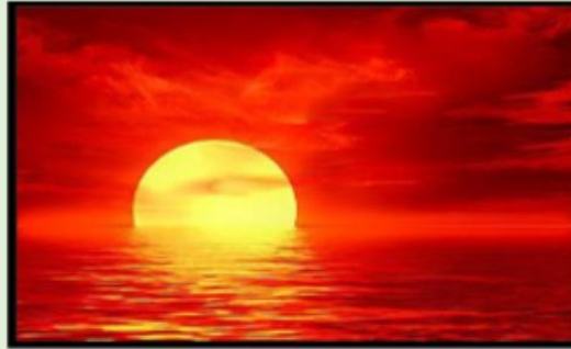
بقاء جزء من قرص الشمس