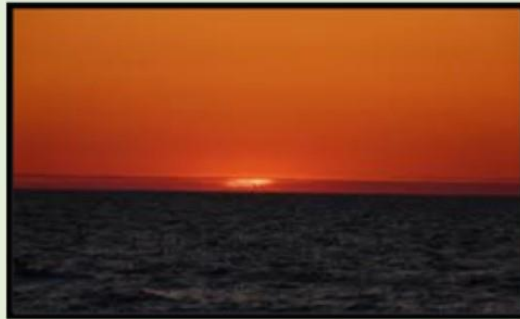
غياب قرص الشمس كاملاً